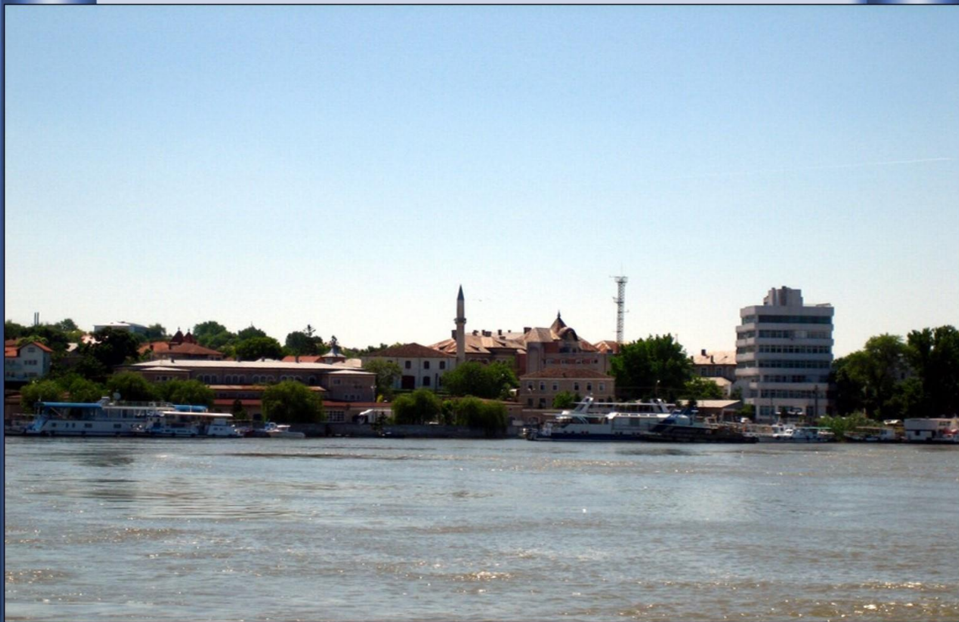
Em Tulcea , quase em fim de percurso