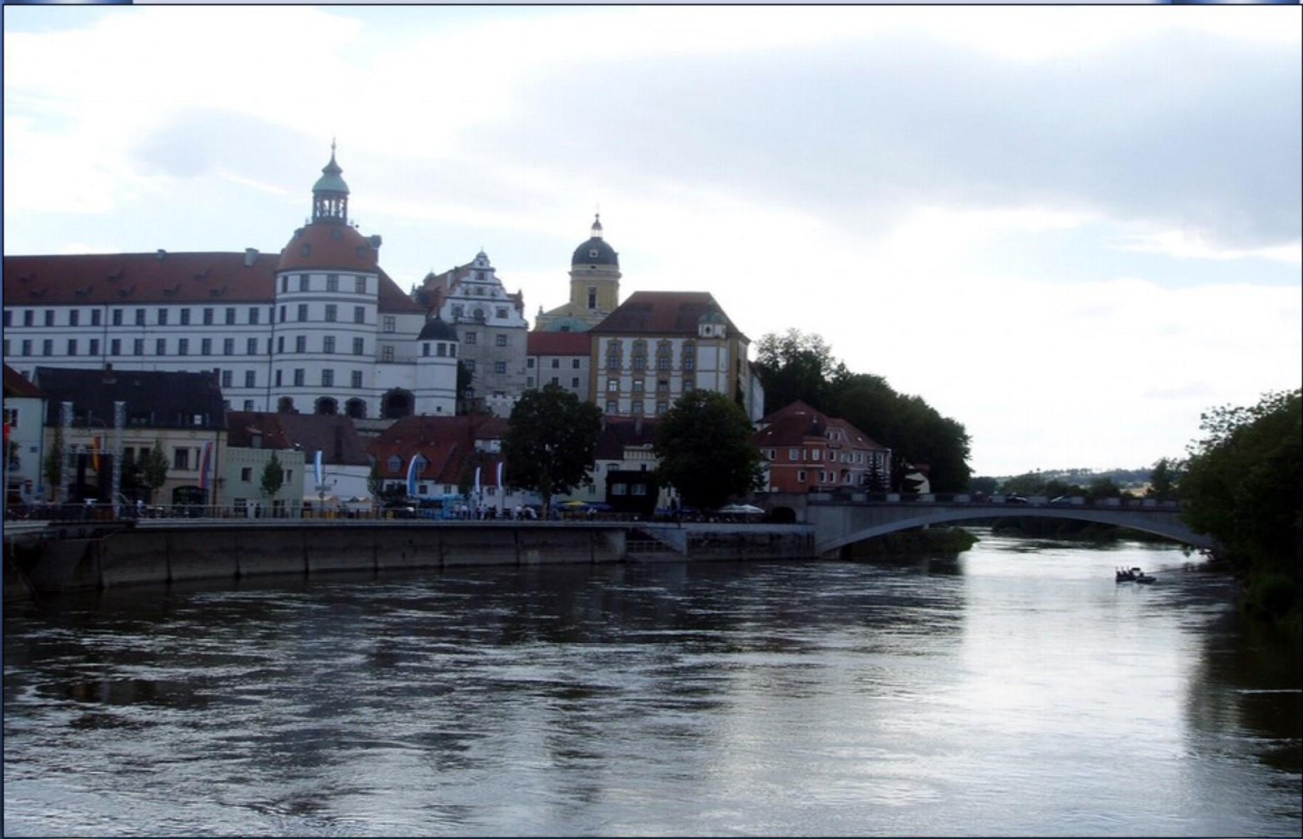
Passando em Ingolstadt (Alemanha)