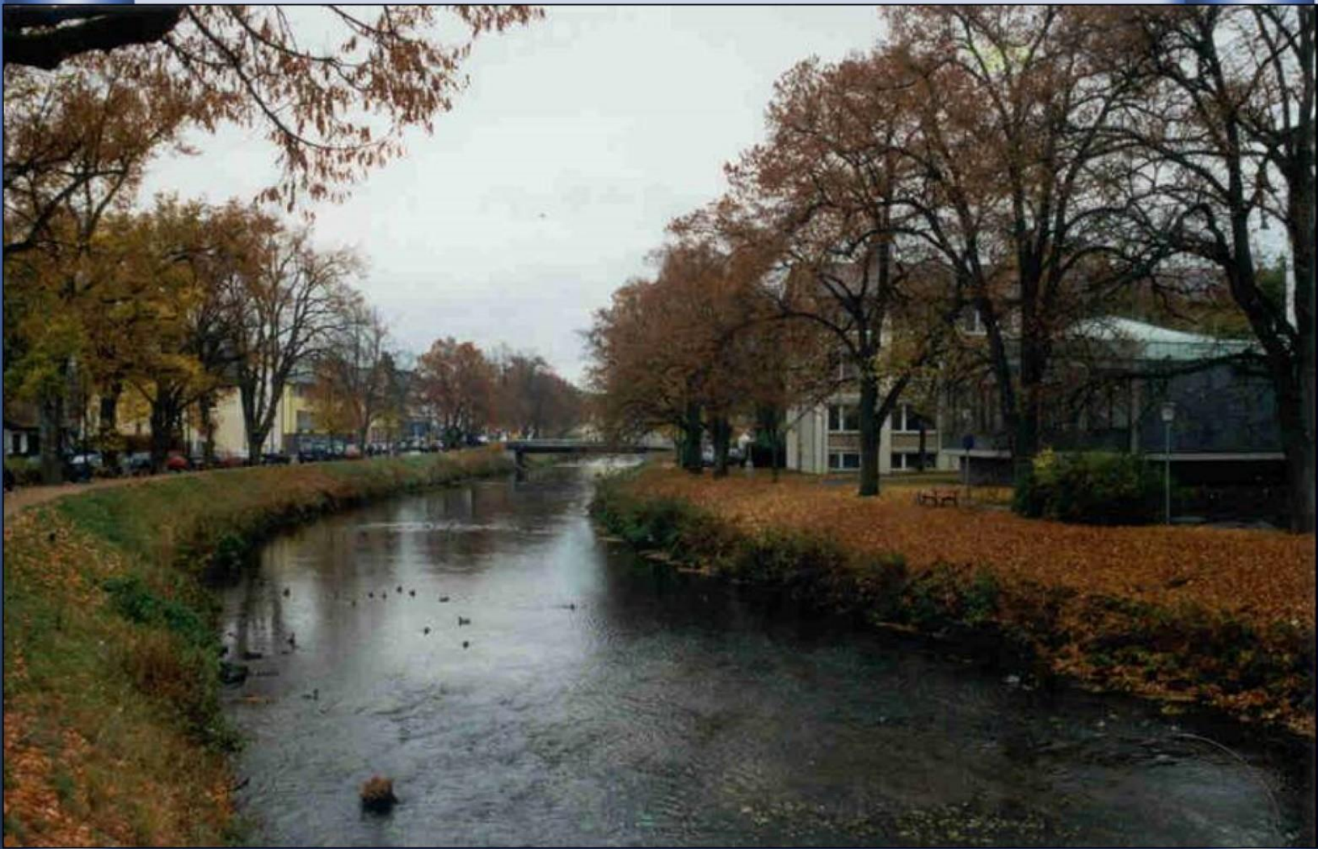
Ainda em Donaueschingen , já como Danúbio