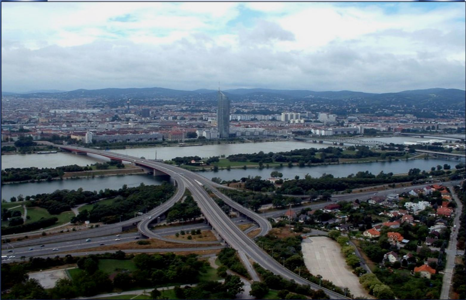
Já na capital da Áustria, Viena