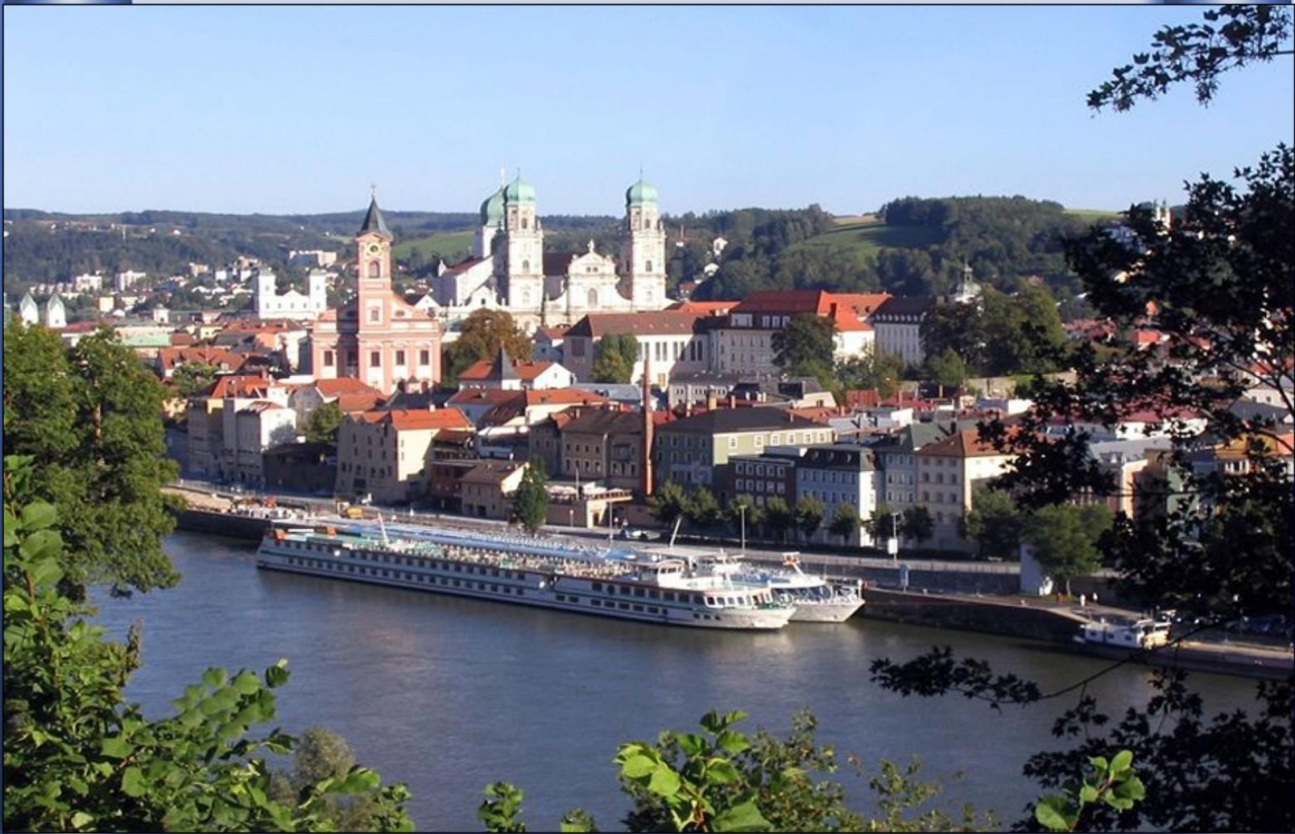
Ainda na Alemanha, em Passau