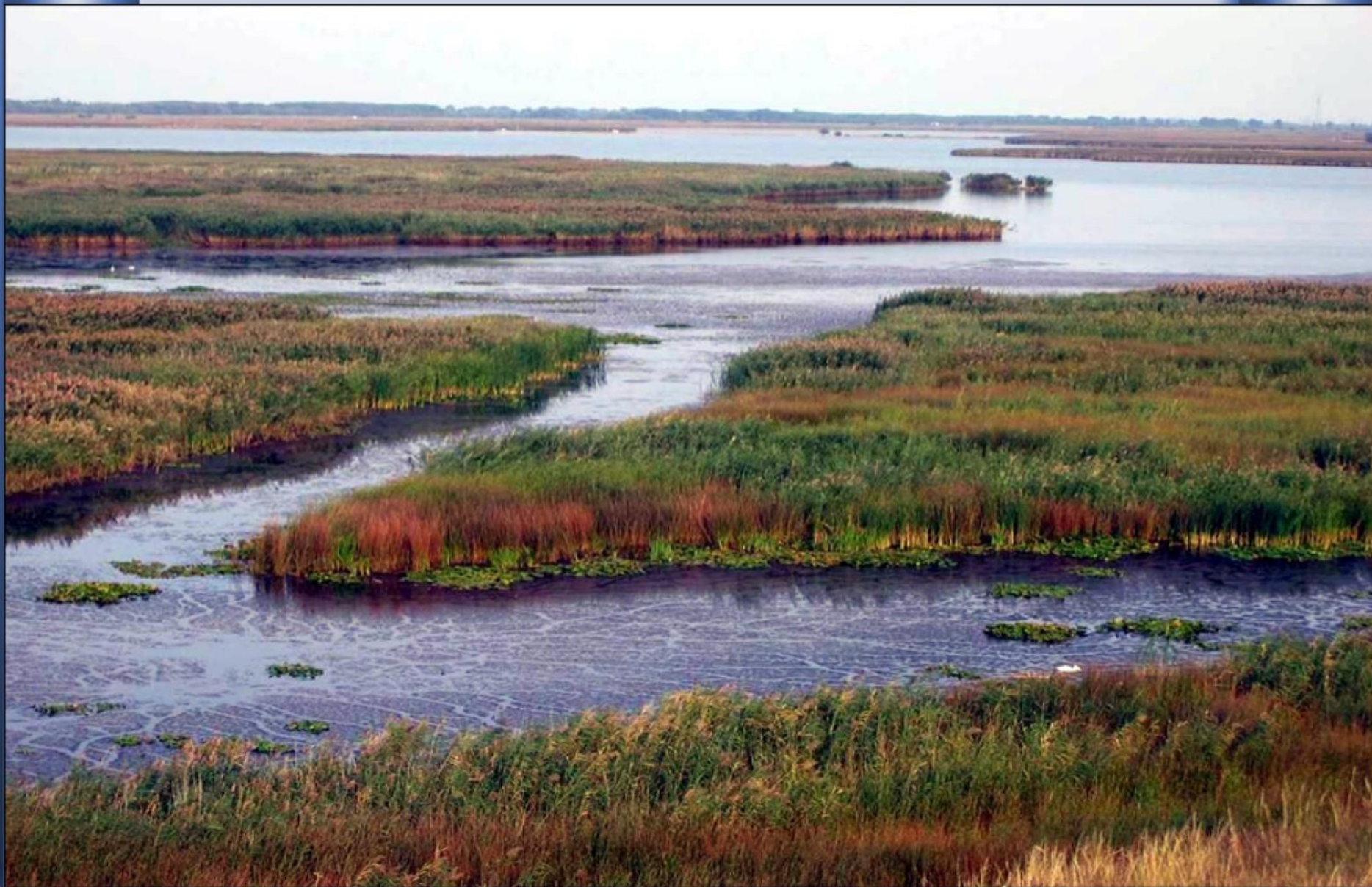
O Delta do Danúbio, região protegida...