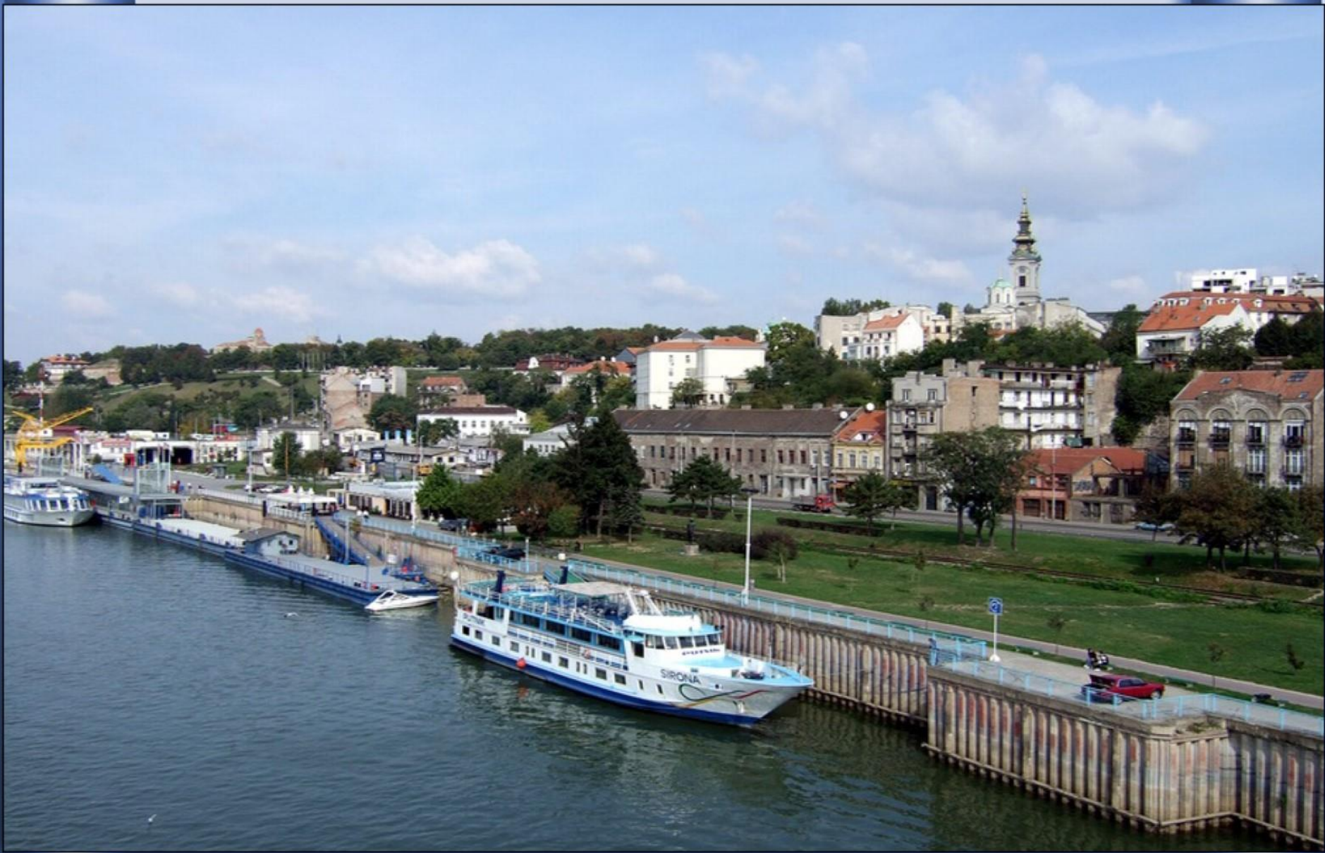
E já banhando Belgrado , a capital da Sérvia