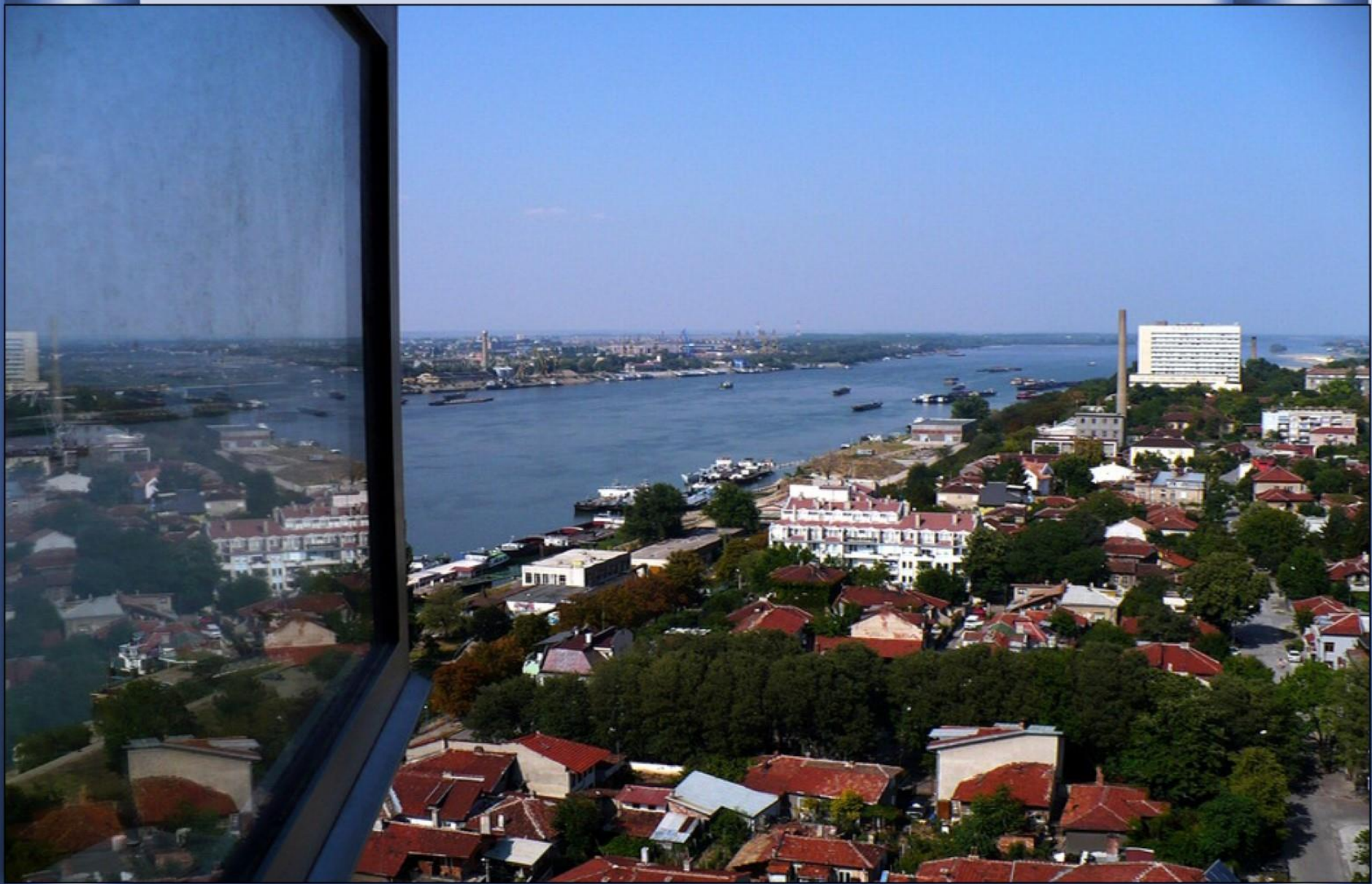
...e em Ruse