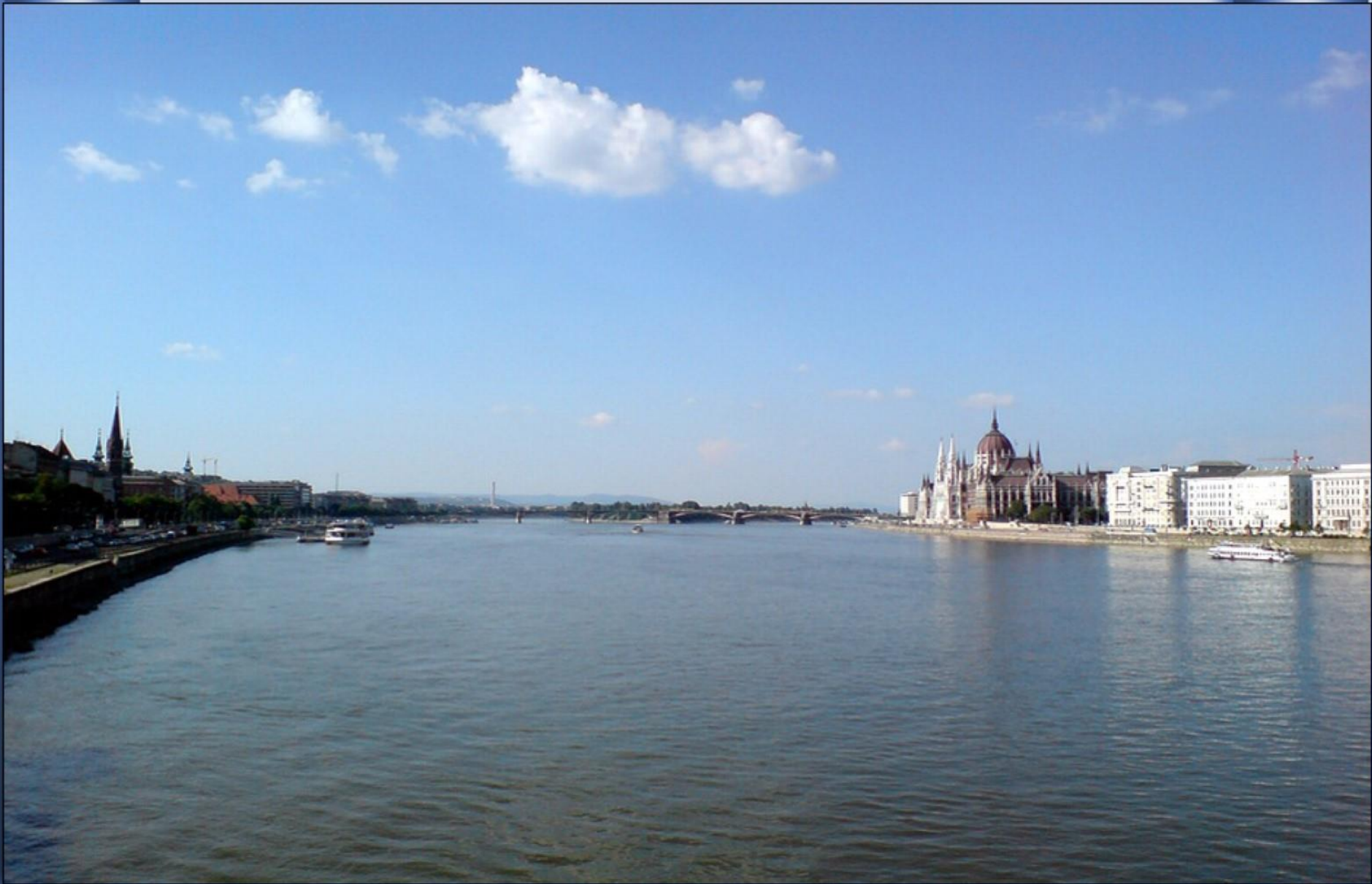
E como “o rio das capitais”, mais uma. Budapeste (Hungria)