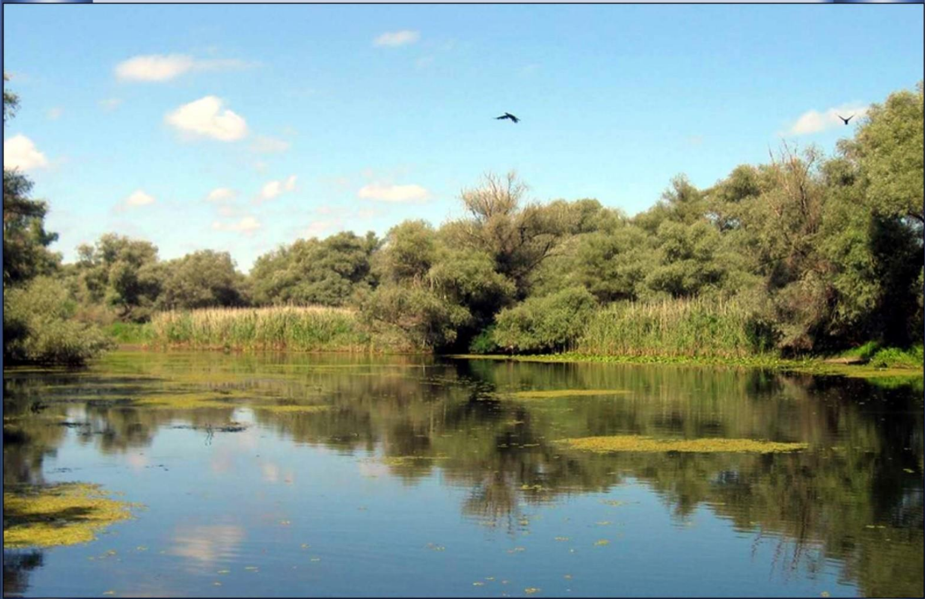
Onde na Floresta Letea , de aspecto tropical, forma um delta