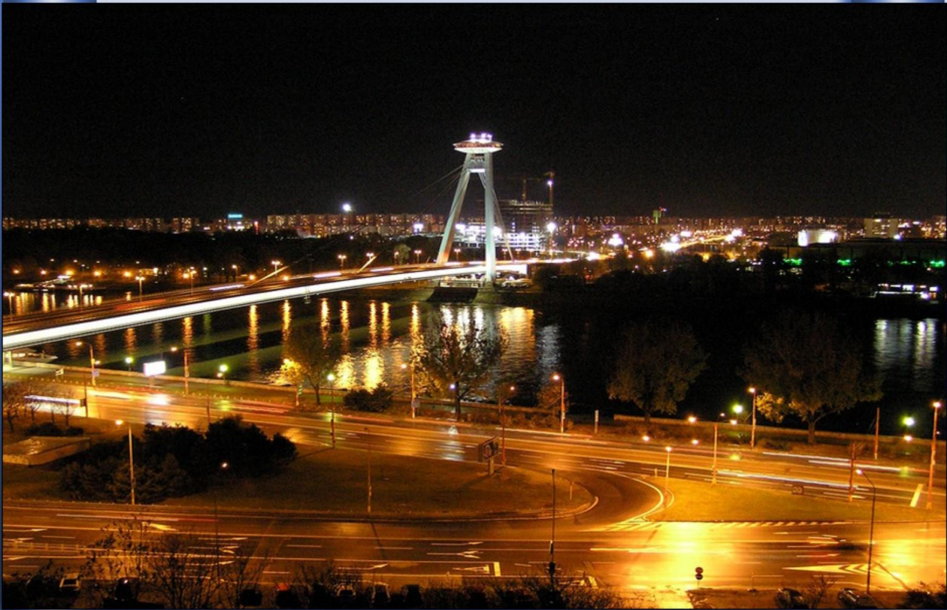
Passando “adormecido” por outra capital. A da Eslováquia. Bratislava