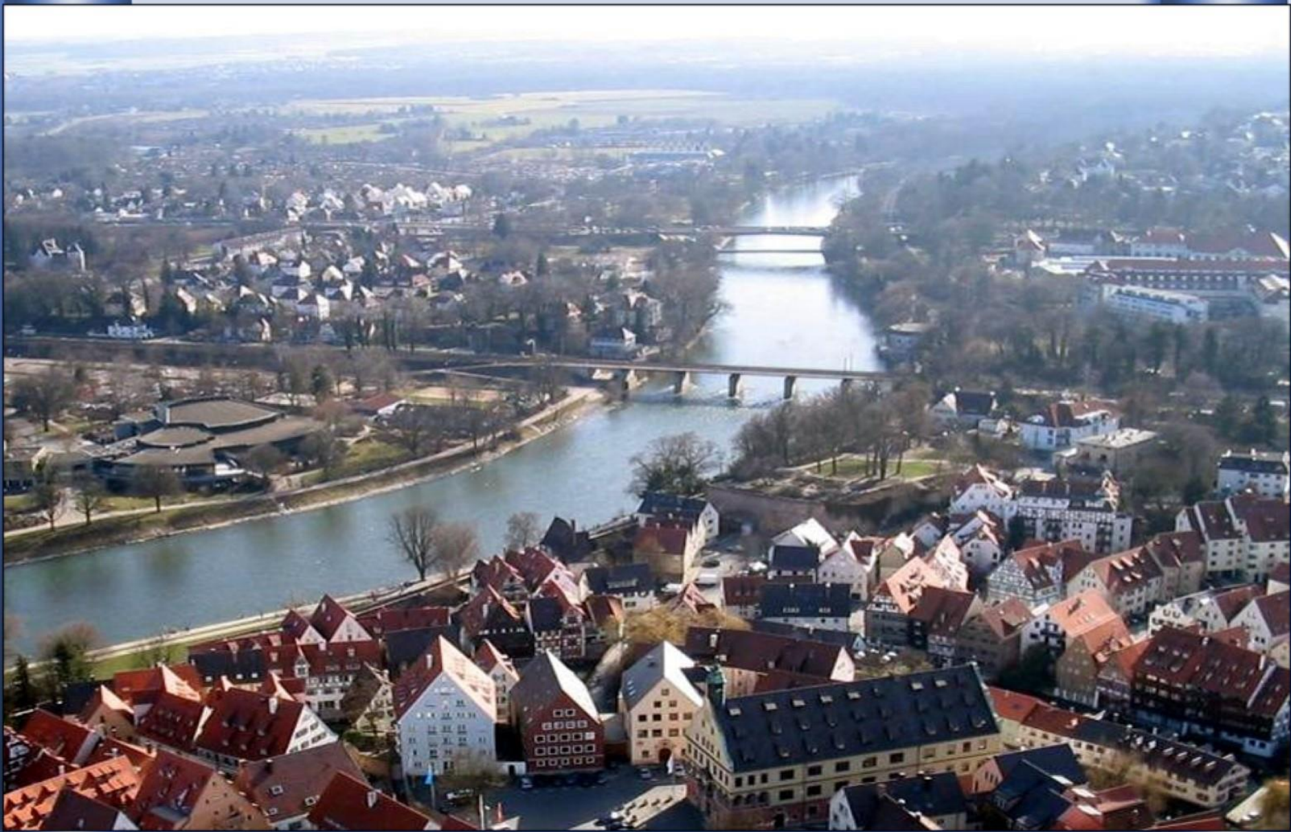
O Danúbio em Ulm (Alemanha)