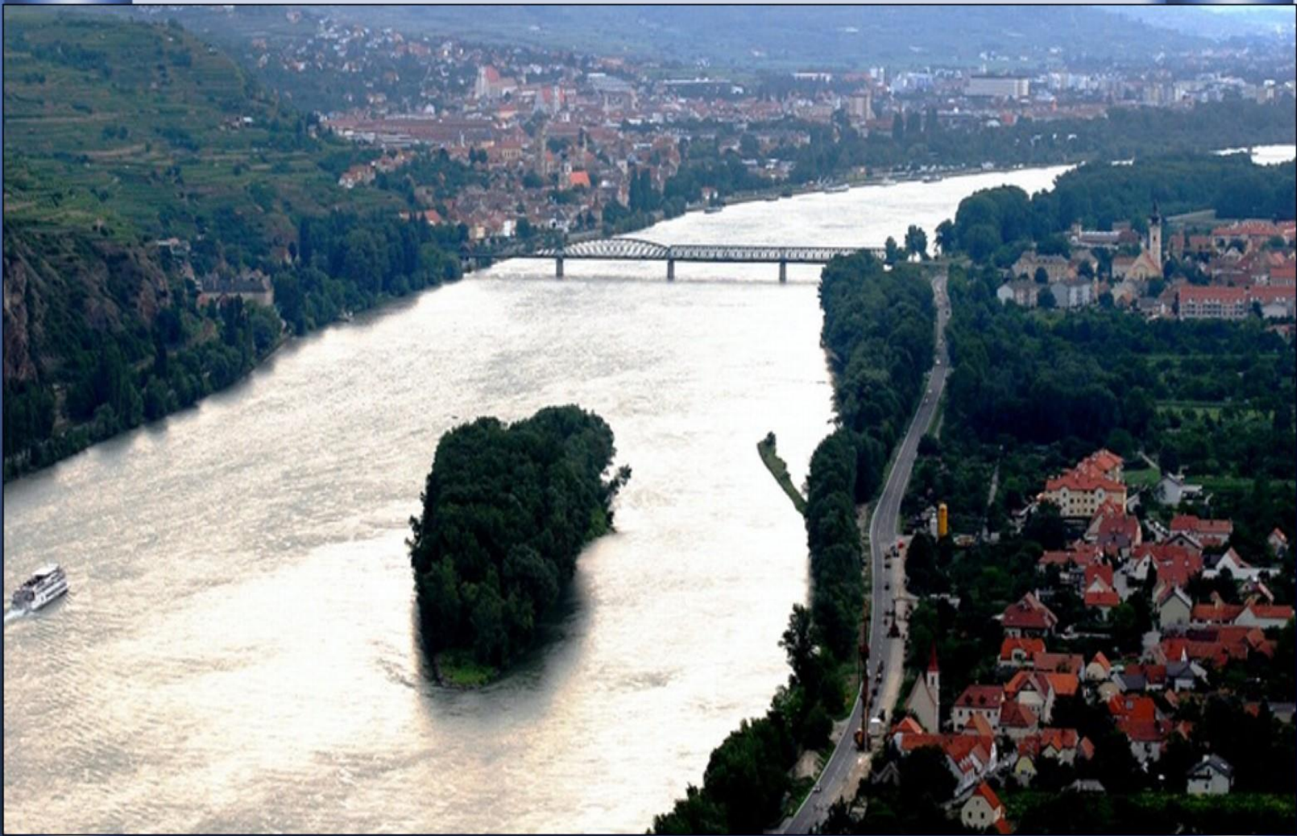
Na sua passagem por Krems (Áustria)