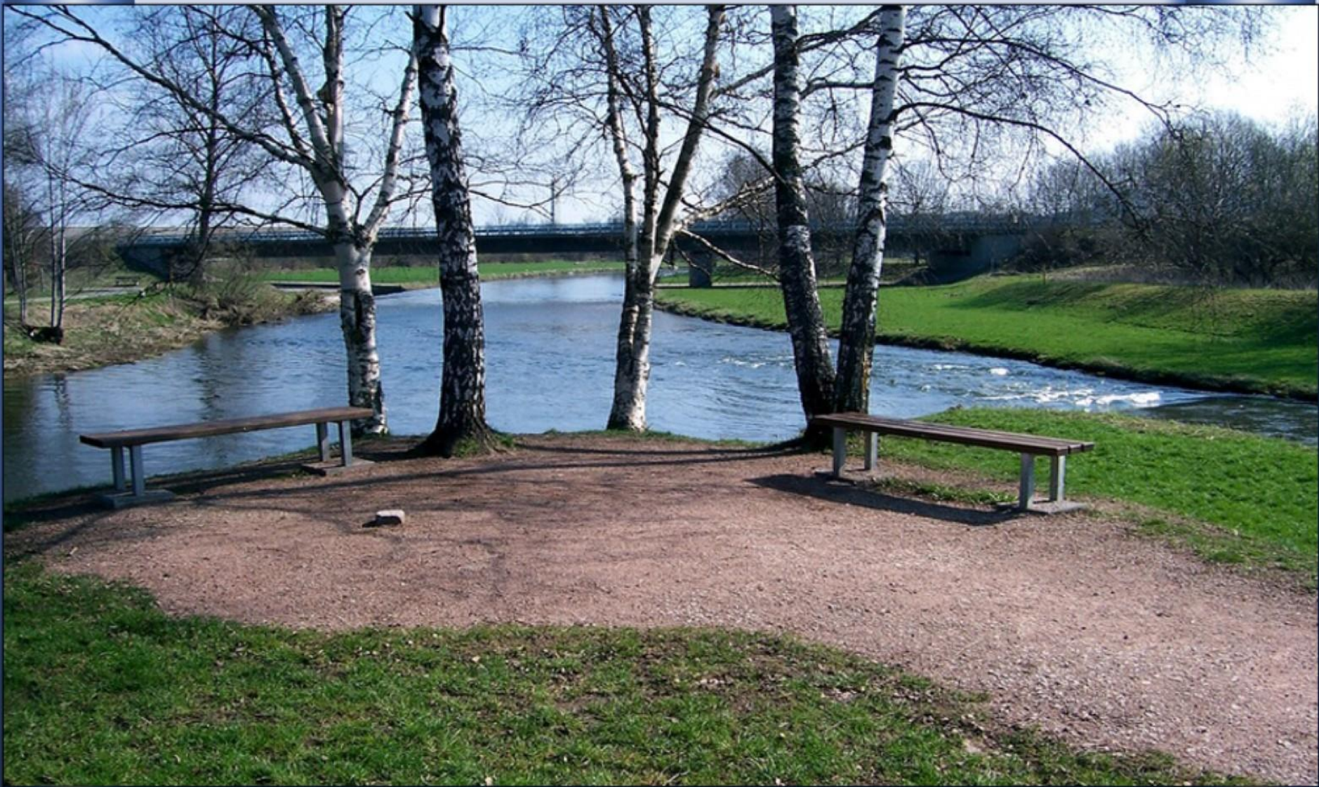
A junção do Brigach (à esquerda) com o Breg (à direita) que origina o Danúbio (ao centro) Em Donaueschingen (Alemanha)