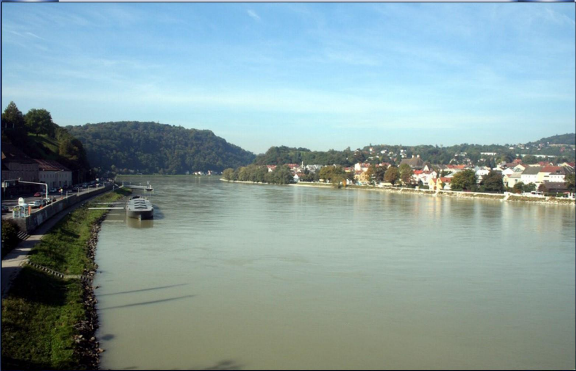
Já na Áustria, em Linz