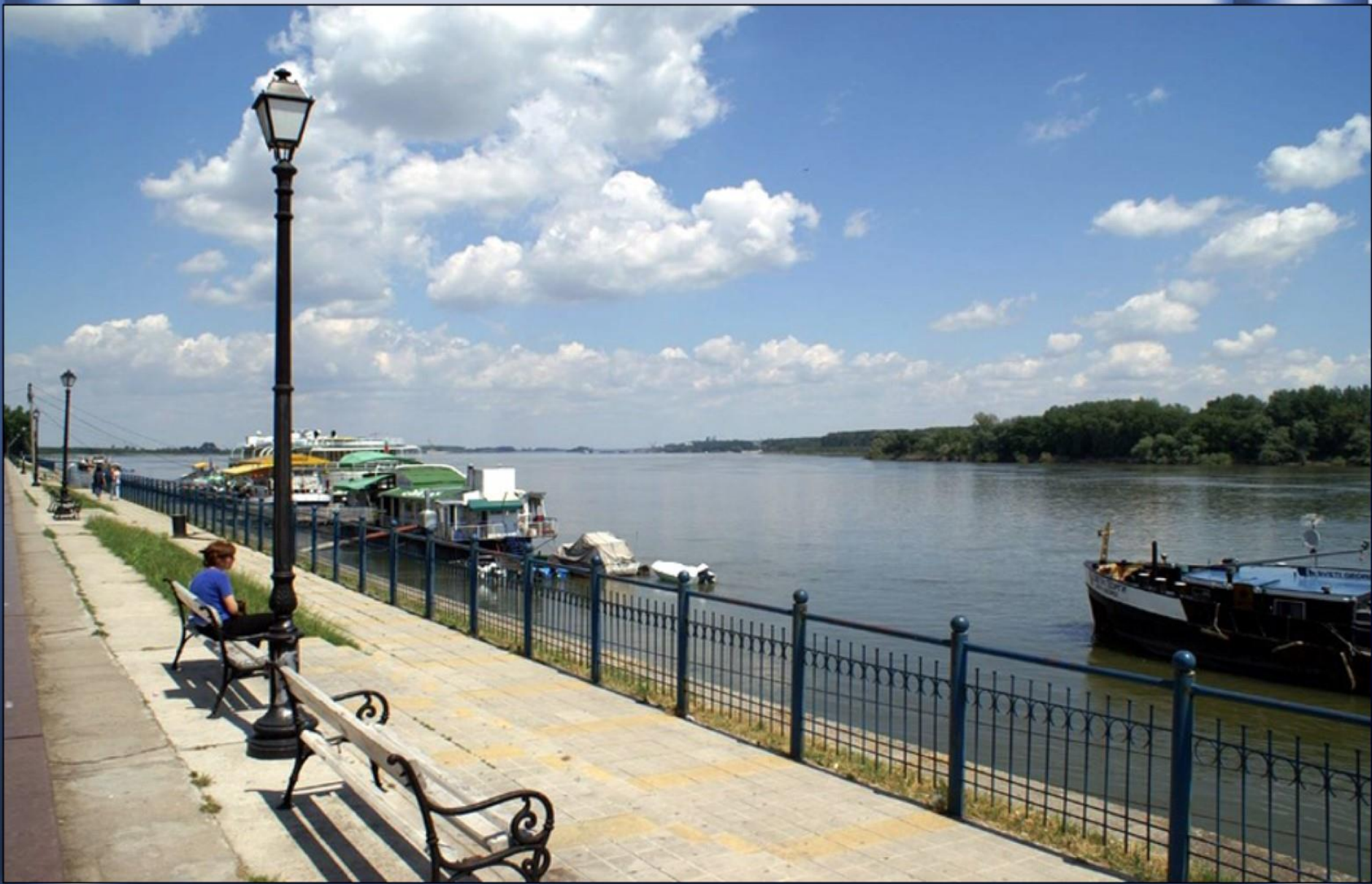
O Danúbio já na sua periférica passagem pela Bulgária. Em Vidin