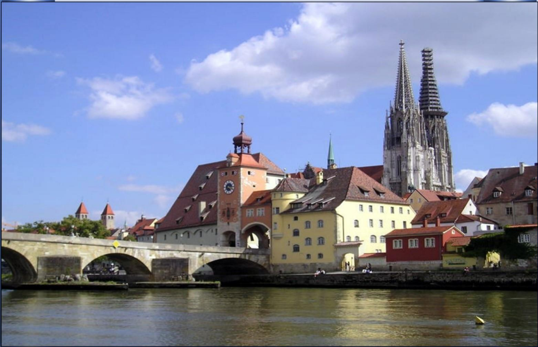
E em Regensburg (Alemanha)