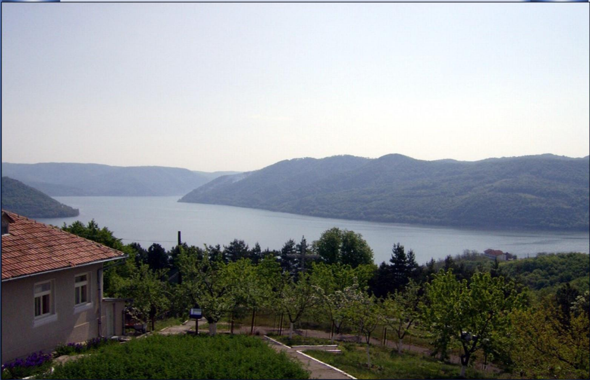
Na sua primeira incursão na Roménia. Em Turnu Severin