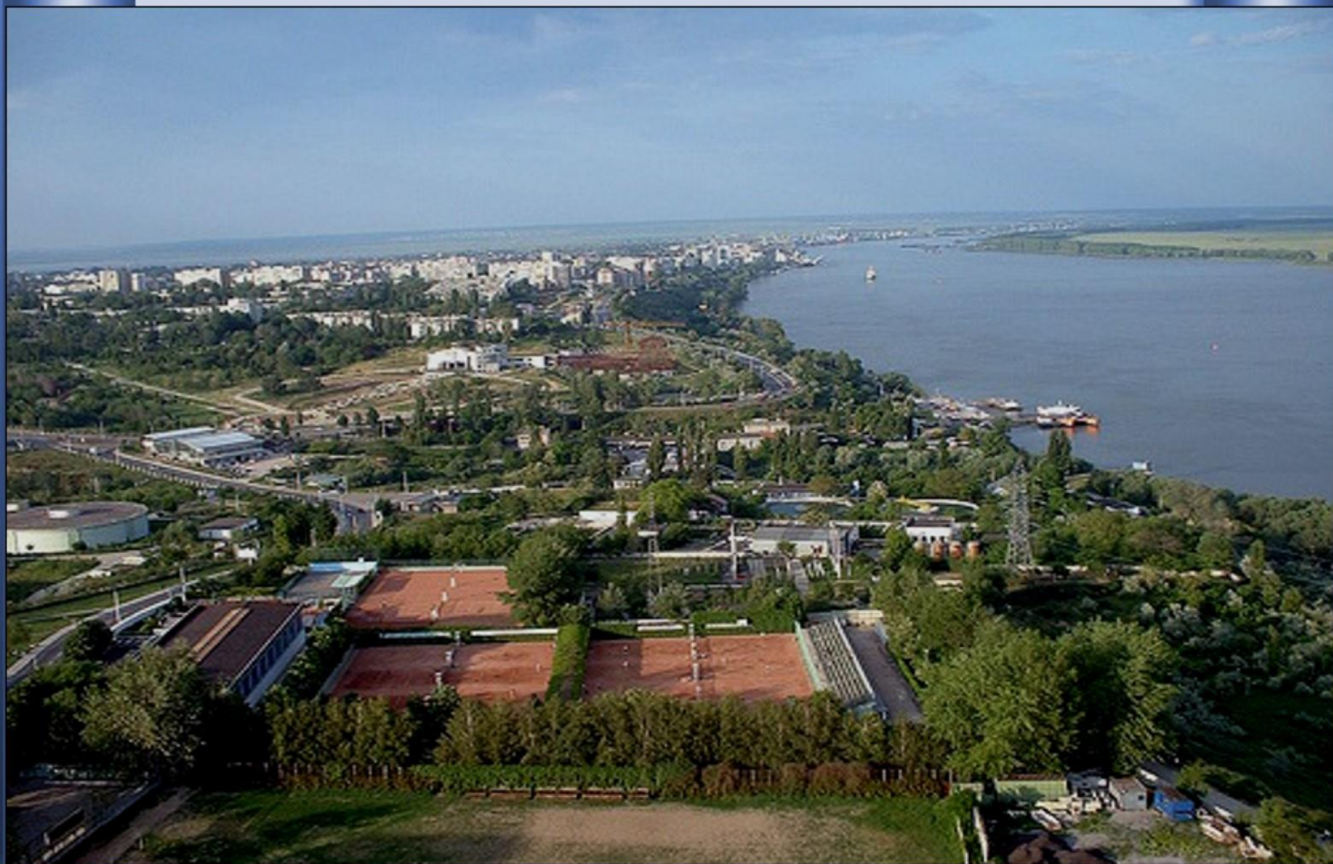
Em Galati na Roménia, o último país que “visita”