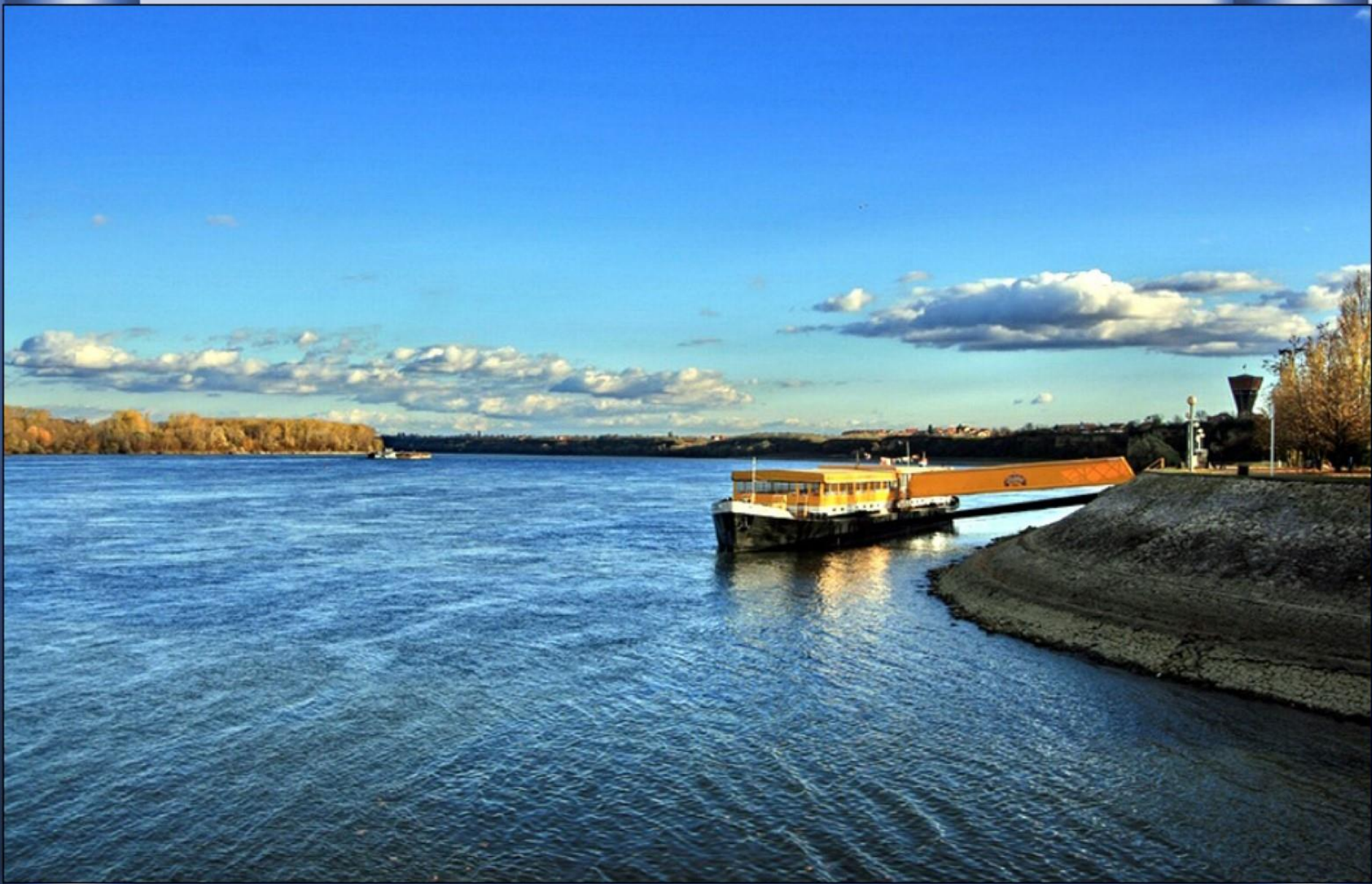
Em território croata. Em Vukovar